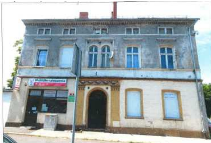
Widok elewacji frontowej – Plac Strażacki nr 5.

na sprzedaż lokalu mieszkalnego Nr 1, znajdującego się w budynku położonym w Lubaniu przy Placu Strażackim 5 wraz z udziałem we współwłasności nieruchomości gruntowej (działka nr 5, AM 4, Obręb III o powierzchni 164 m 2 , JG1L/00020876/7)